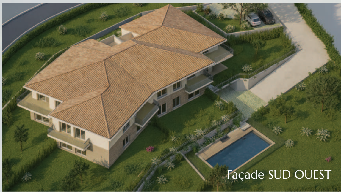
Façade SUD OUEST