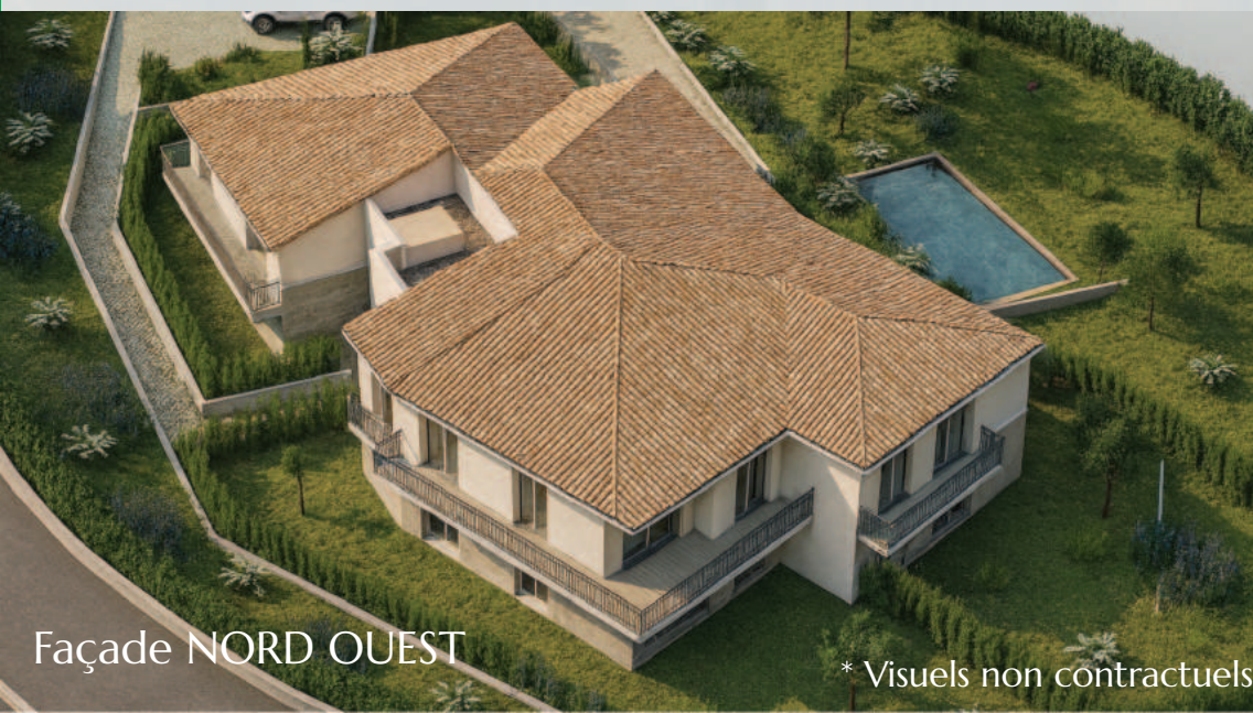
Façade NORD OUEST

Proche des commerces, des plages, des écoles, des terrains de golfs et du centre ville de Mandelieu-La-Napoule, cette résidence de bon standing est située dans un quartier résidentiel.