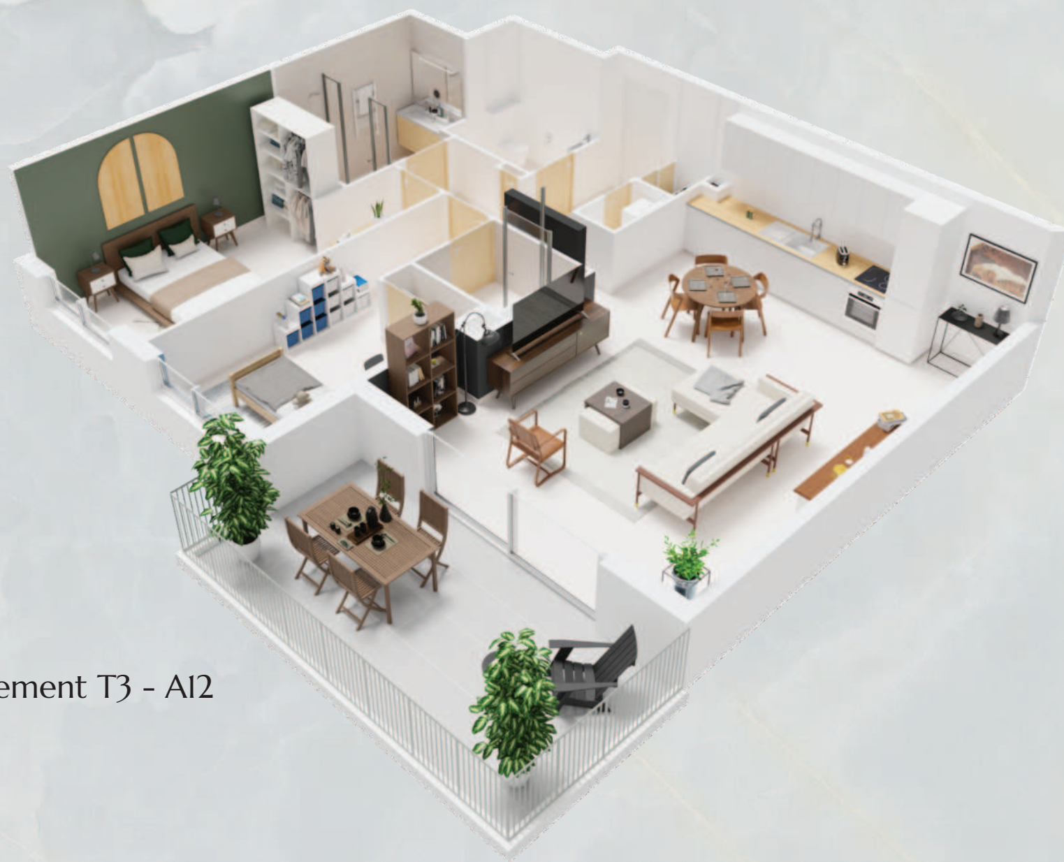
Exemple d'aménagement T3 - A12

Nous vous proposons un vaste choix d'appartements bénéficiant tous d'une parfaite exposition et de points de vue agréables. De type T3 et T4, chaque appartement a été pensé avec soin et réflexion pour obtenir des volumes généreux et de grands espaces extérieurs.